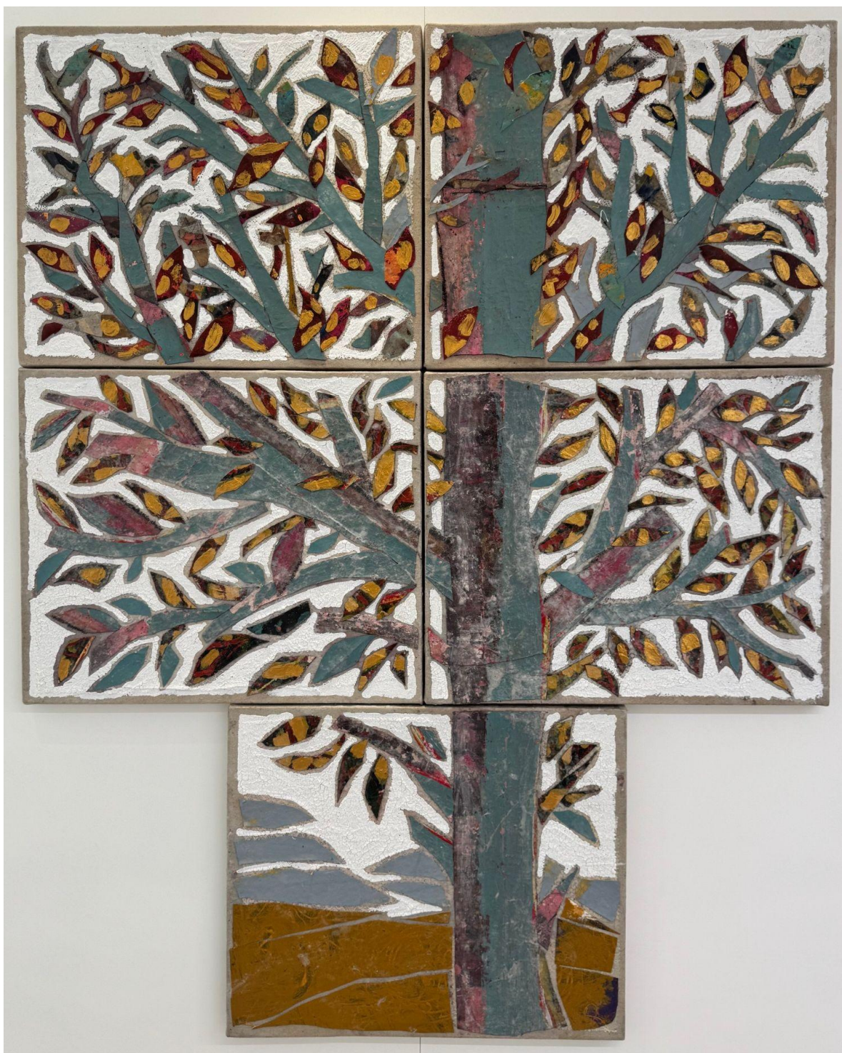
Untitled 5 stretched canvas with acrylic and collages Each 45 x 50 cm Executed in 2025