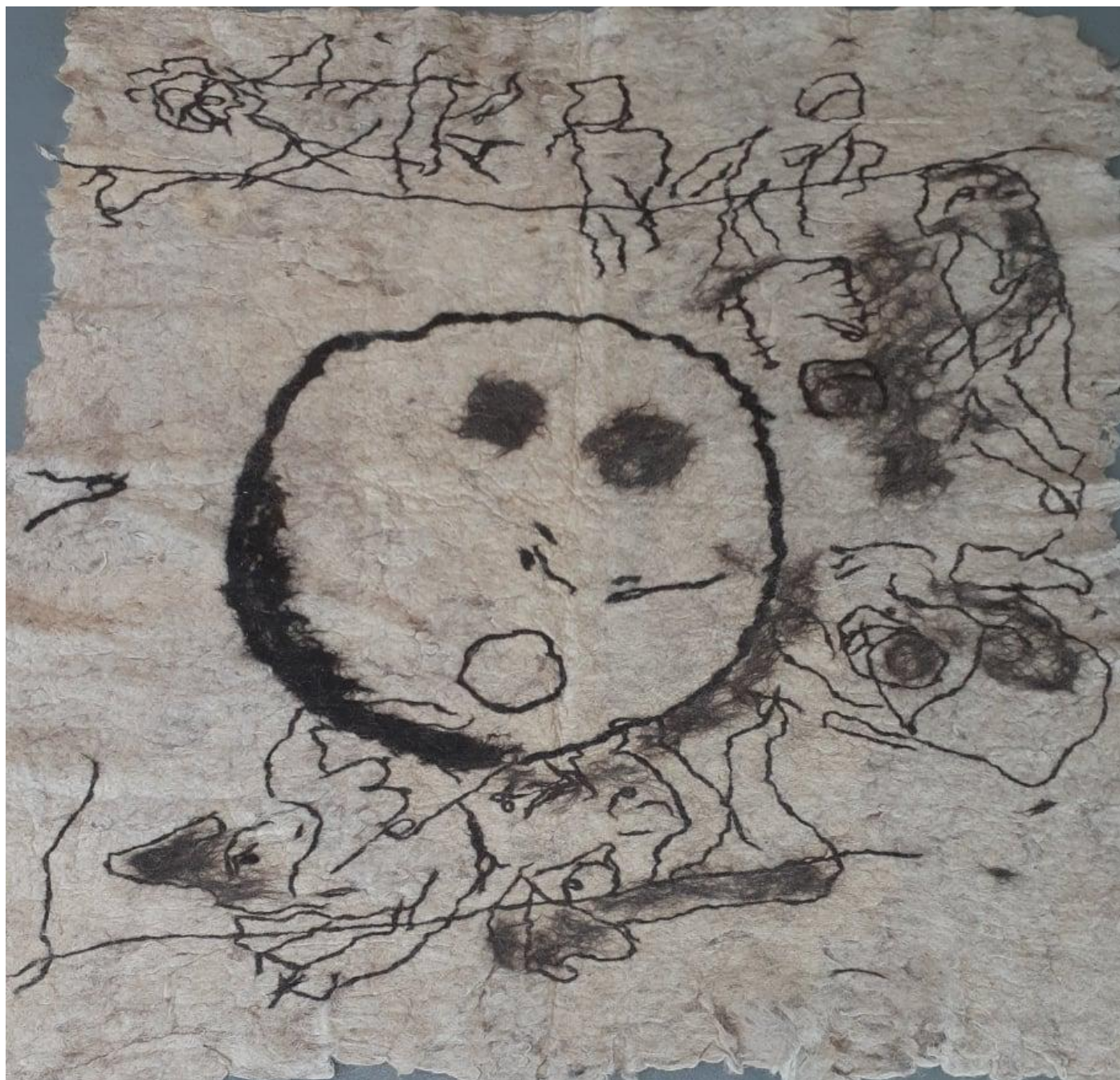
Untitled Tekemet Bas-Relief (ZRFT) 195 x 205 cm Executed in 2017