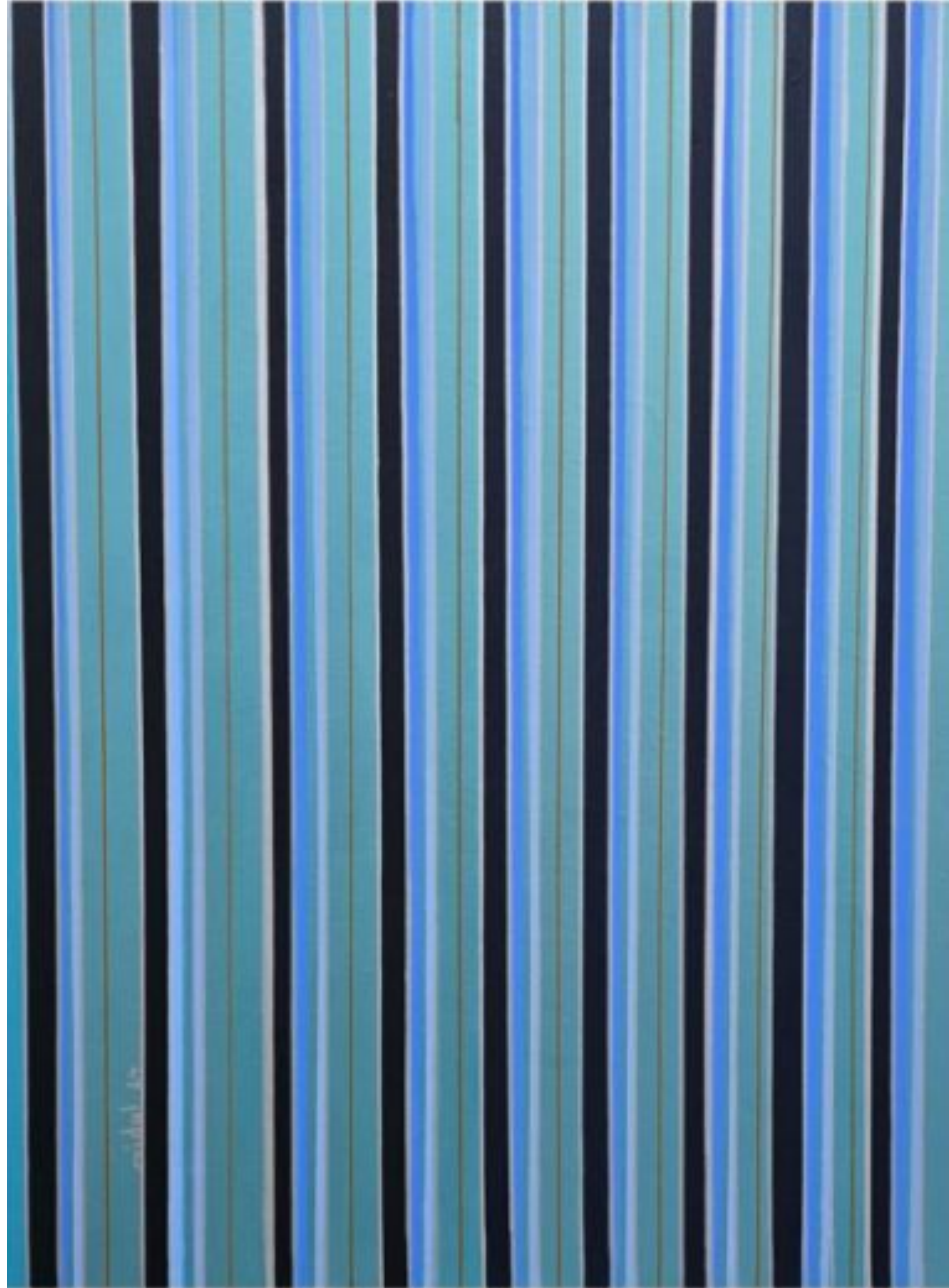
Sadu ( 4 ) Acrylic on canvas 80 x 60 cm Painted in 2024