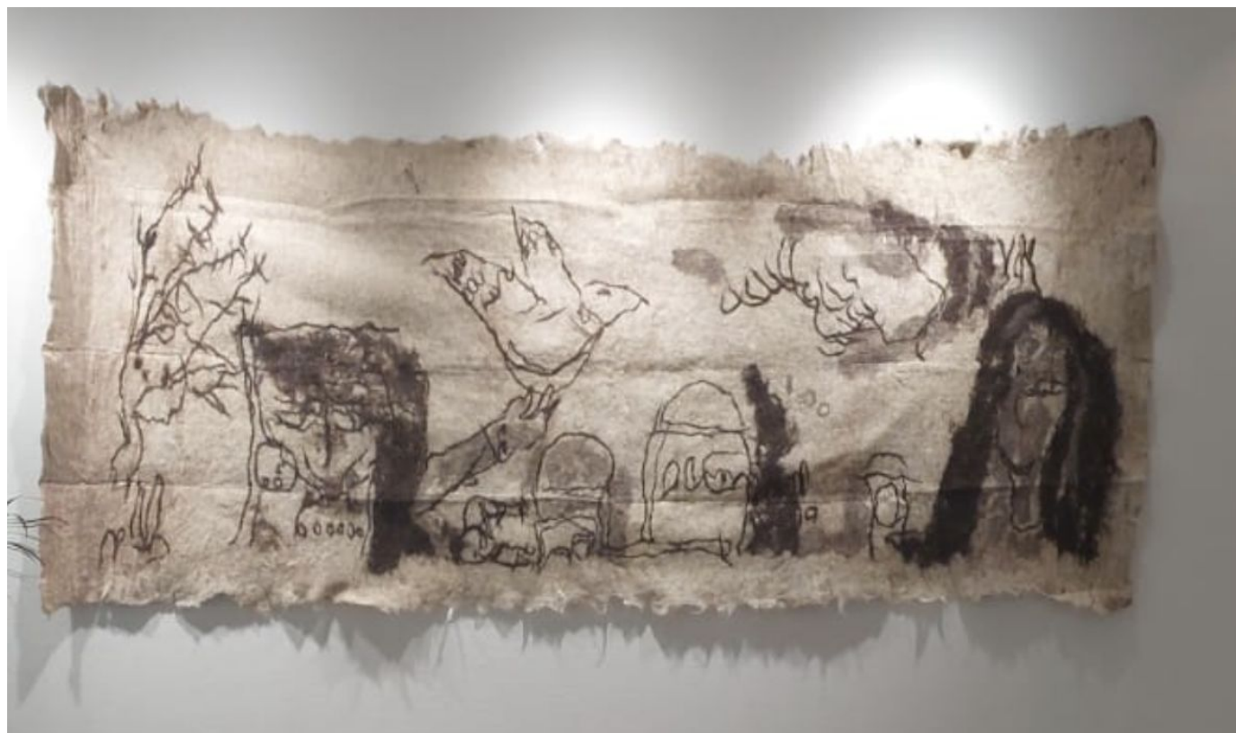
Untitled Tekemet Bas-Relief (ZRFT) 285 x 120 cm Executed in 2017