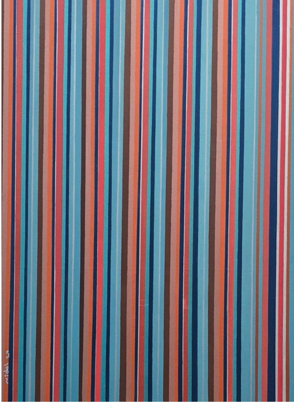
Sadu ( 3 ) Acrylic on canvas 80 x 60 cm Painted in 2024