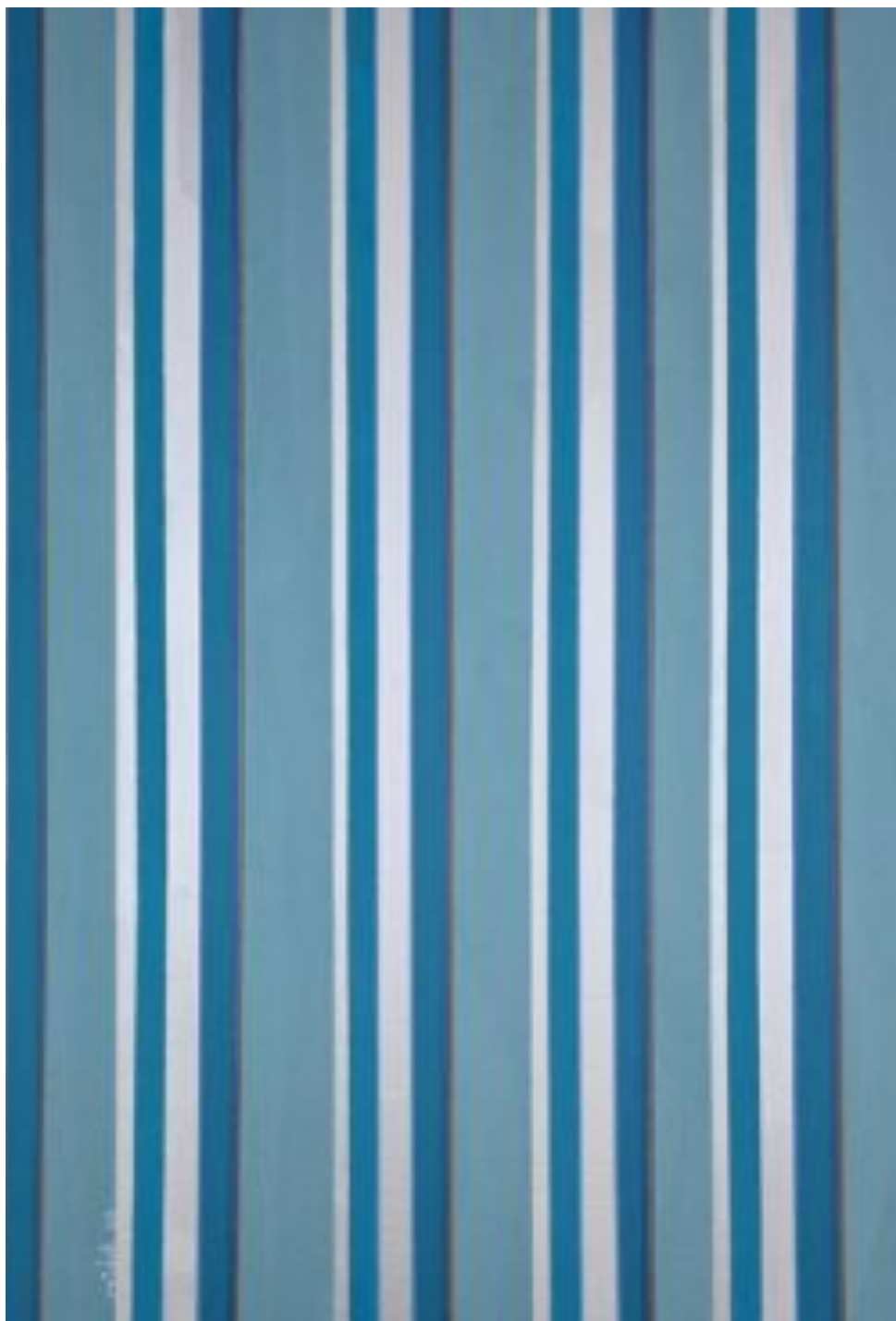
Sadu ( 2 ) Acrylic on canvas 80 x 60 cm Painted in 2024