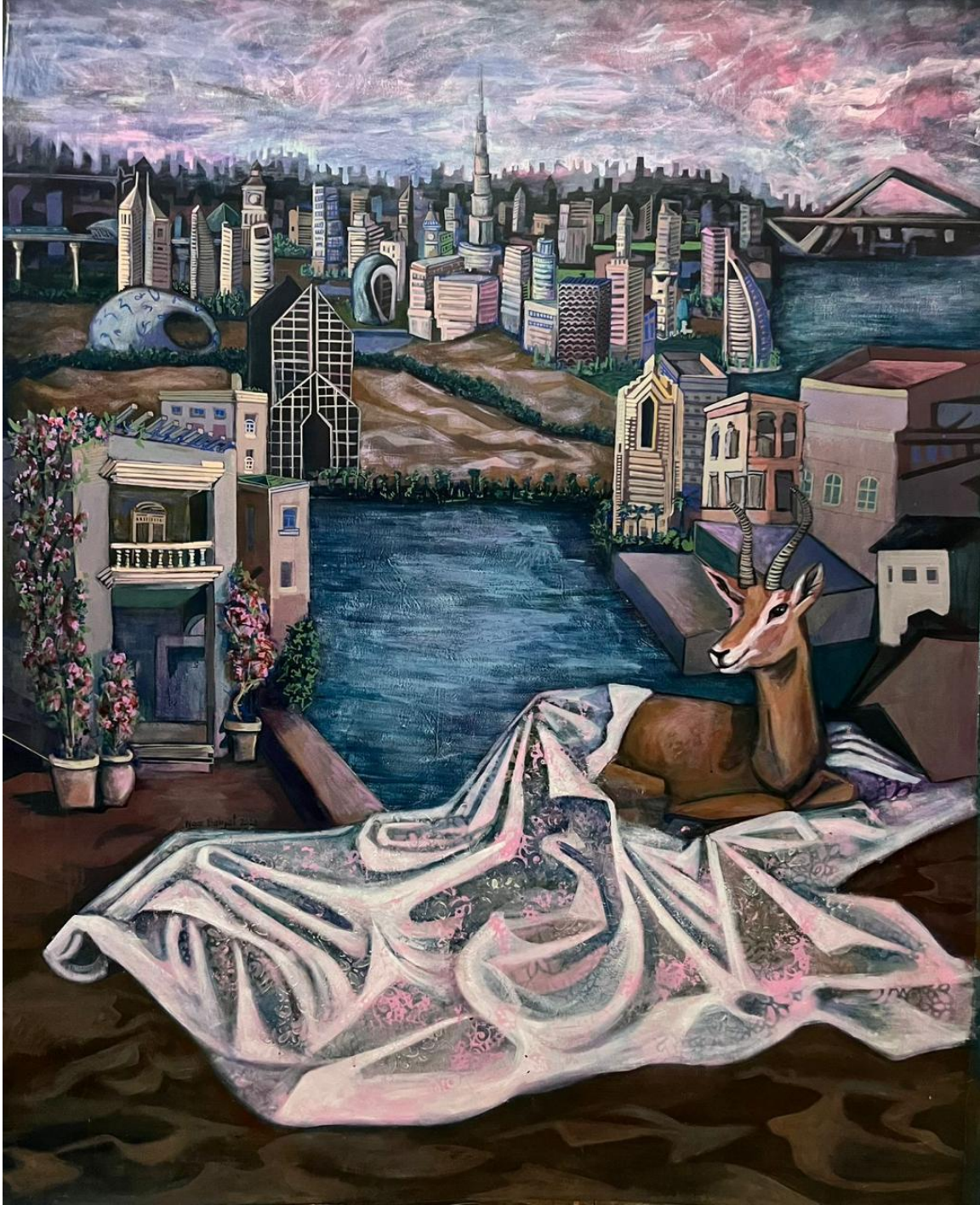
Luxurious city Acrylic on canvas 180 x 150 cm Painted in 2023