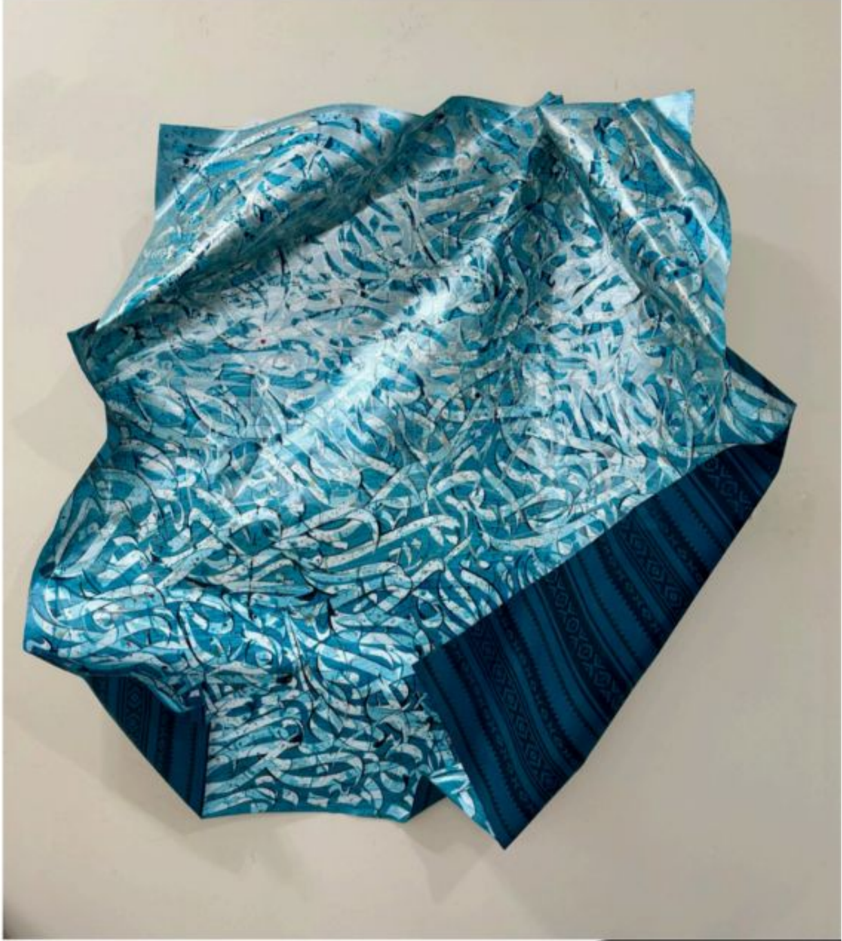
Damascene Brocade Metal sheet and acrylic and mixed media 180 × 150 × 10 cm Executed in 2025